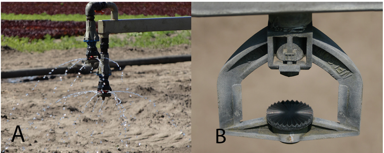
Figur 4. Olika bevattningsmunstycken under användning (A) och i närbild (B).