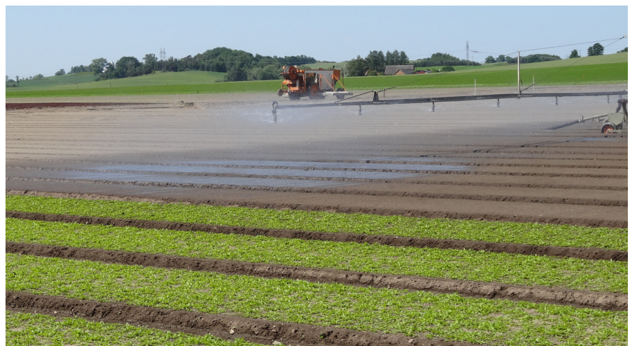
Figur 2. Bevattningsramp