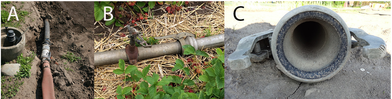
Figur 3. Rörskopplingar. Koppling från nedgrävt stamledningsnät till flexibel slang (A); galvaniserade bevattningsrör med snabbkoppling (B); närbild på insidan av bevattningsröret vid kopplingsstället (C).

finns studier som visar att metanhalten samt halten av organiska ämnen, såsom myrsyra och ättiksyra, i bevattningsvattnet bidrar till proppbildning. Designen på munstyckena kan också påverka hur lätt de sätter igen, genom tryckkompensation och variation i flödes hastigheten kan problemen och riskerna minska.