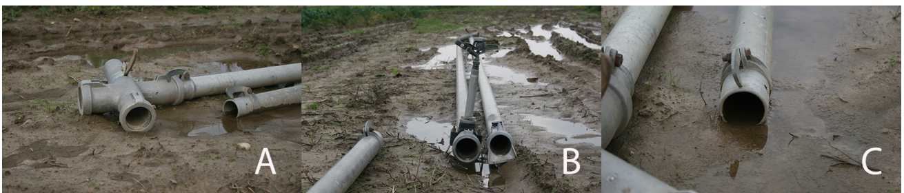
Figur 5. Olämplig hantering av bevattningsrör i fält. Både koppling och rör kan kontamineras av djur och förorenat vatten (A), rör upphöjda i ena änden men de kontamineras samtidigt i den andra änden (B), vatten stående i röret (C)